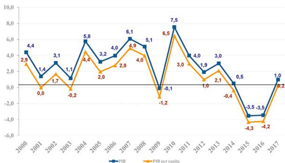
PIB e PIB per capita Taxa (%) de crescimento anual