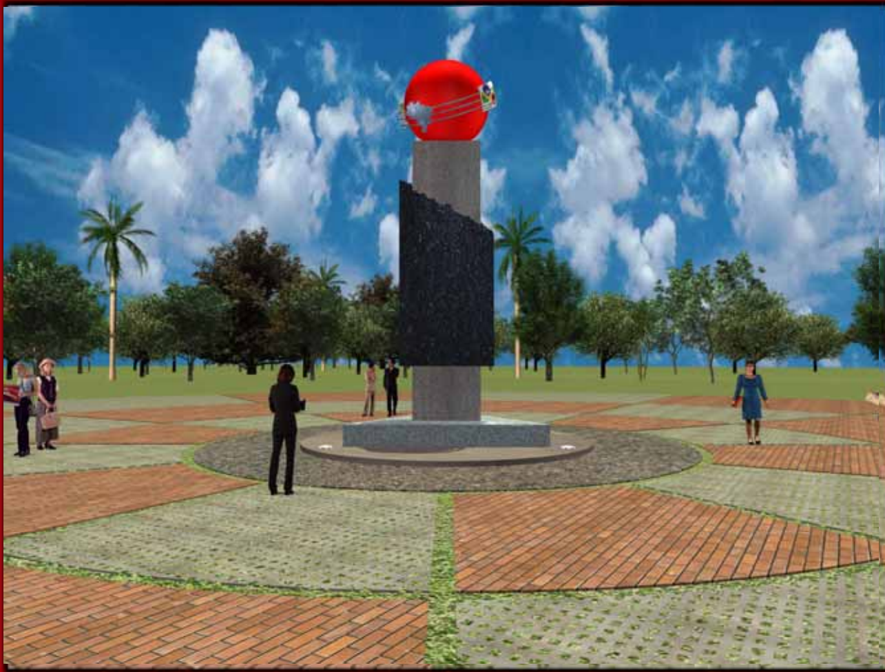
Monumento à Imigração – fotomontagem