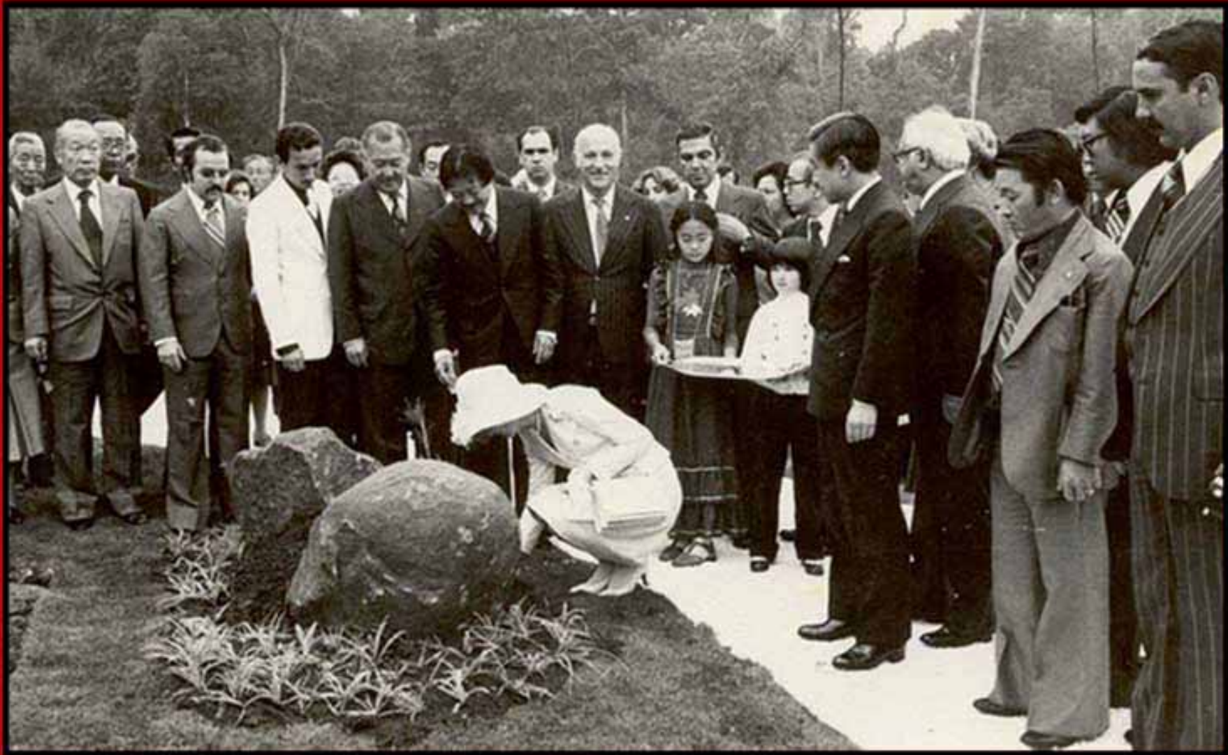
Visita do Imperador Akihito e da princesa Michiko ao Parque de Ingá