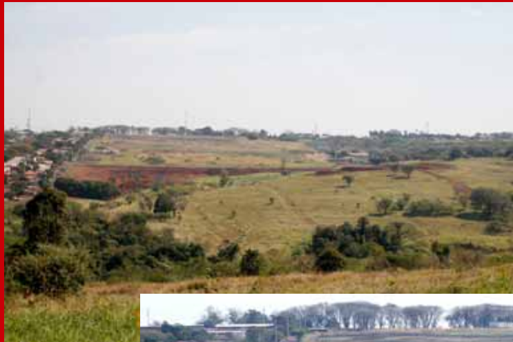
Vista Geral do Parque do Japão