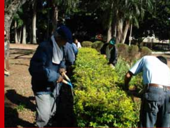
Podas Diversas - Praça Napoleão Moreira da Silva - Dia 26 de Maio de 2007