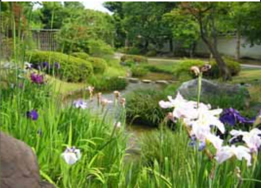
B-Centro de Eventos