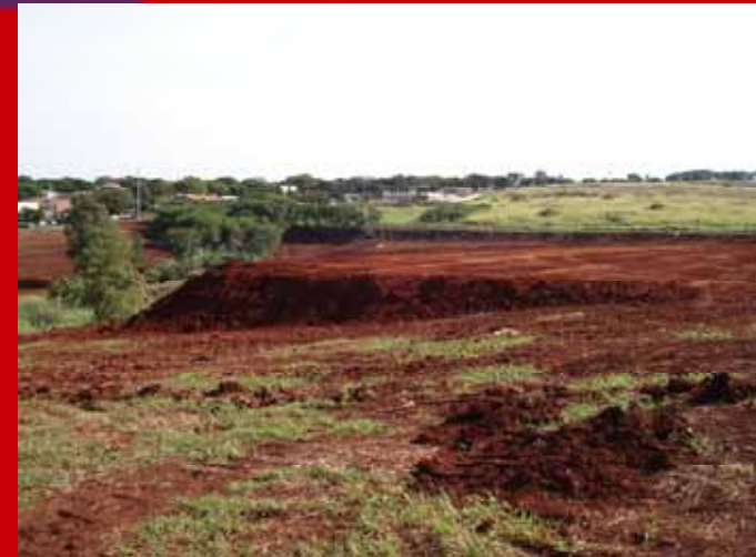
Vista Geral do Parque do Japão