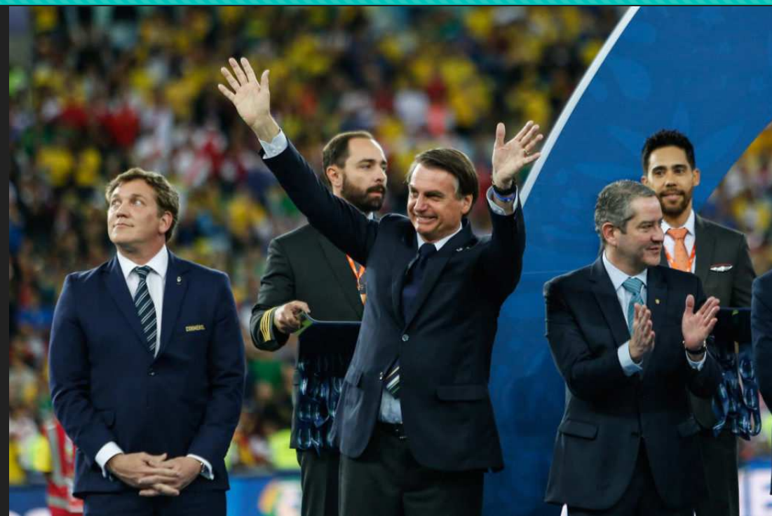
ボウソナロ大統領