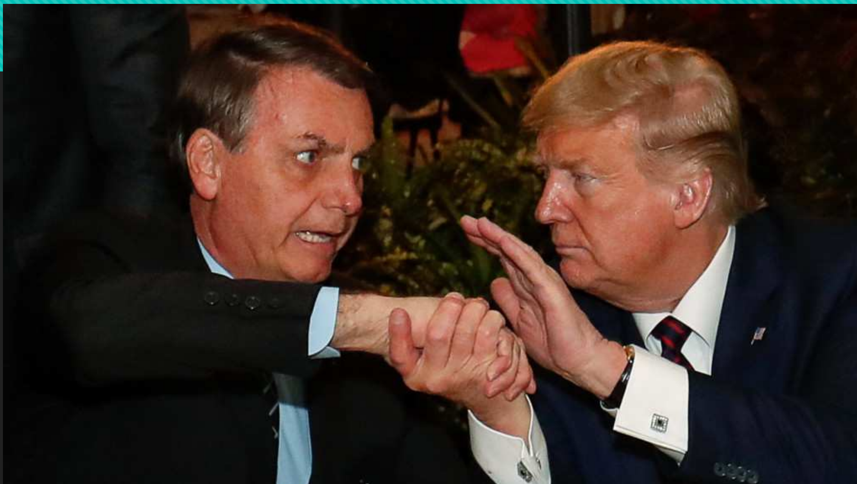
ボルソナロ、トランプ両大統領