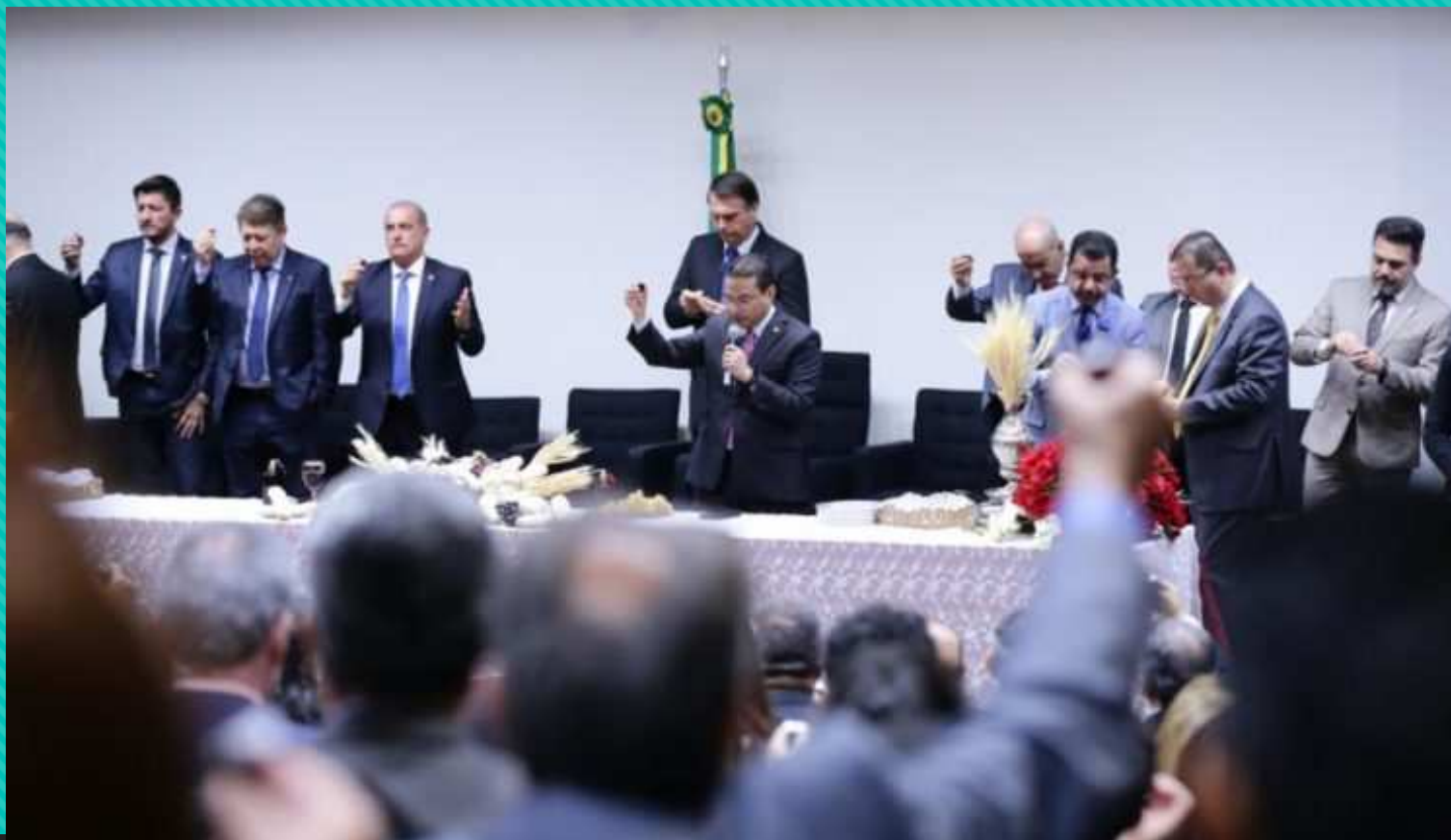
クリスマスの前夜祭ミサに参加する下院議員たち

1994年には513人中、 21人 の連邦下院議員しかいなかった bancada evangélica は、今では 105人 の下院議員、 15人 の上院議員まで増えた。 連邦議会の約20% を占めている。