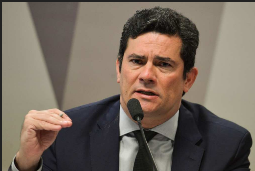
福音派法律家全国協会 (Associação Nacional dos Juristas Evangélicos) のメンバー