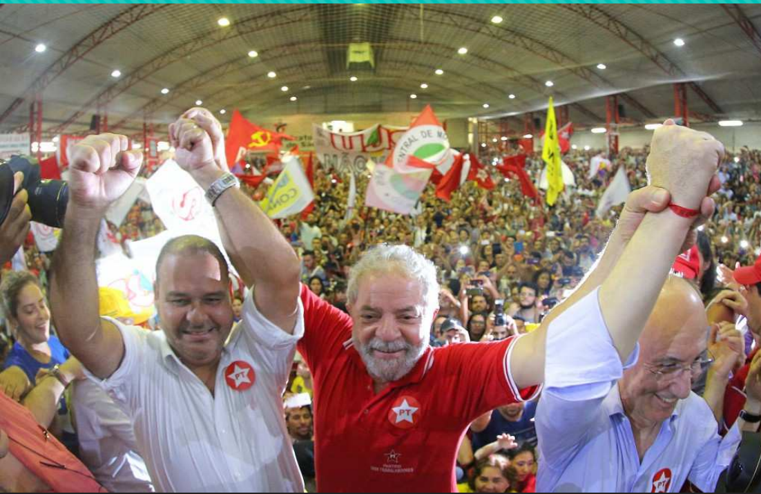
PT党本部で仲間にもまれたカリスマ、ルーラ