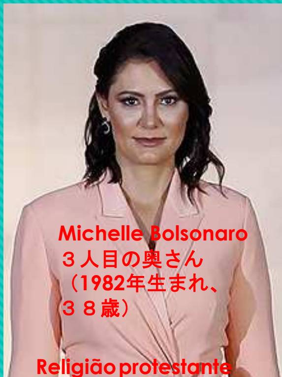
Michelle Bolsonaro 3人目の奥さん (1982年生まれ、 38歳)