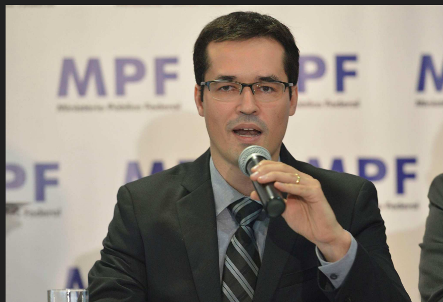
敬虔なプロテスタント・バチスタ派信者 (Igreja Batista do Bacacher)