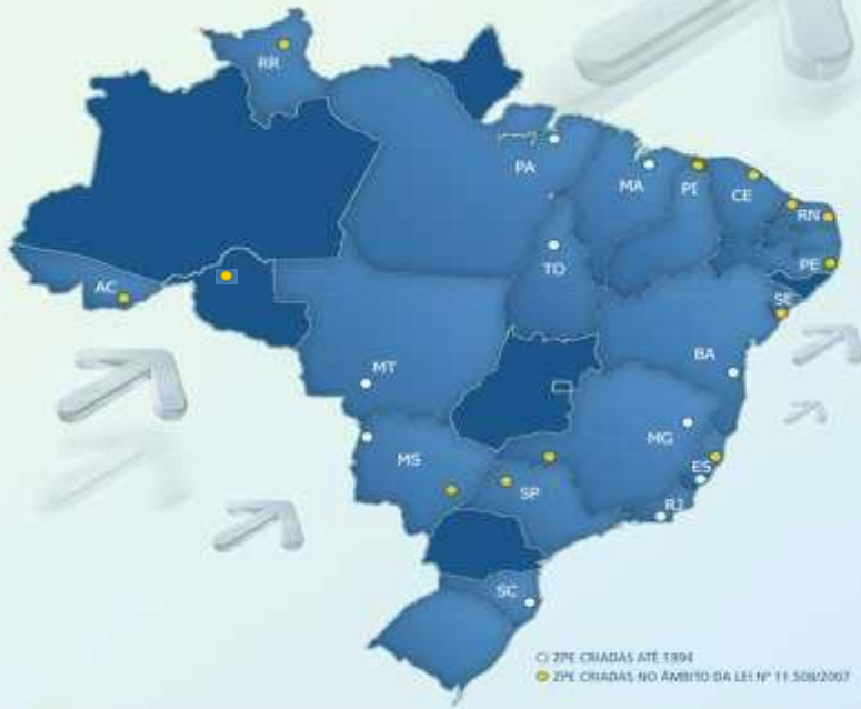
LOCALIZAÇÃO DAS ZPE NO PAÍS