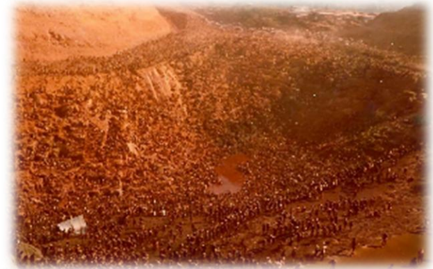
Fotos da nova mina de Serra Pelada, no Pará

Exploração deve começar em 2012; empresa prevê extrair 50 toneladas de minérios em dez anos.