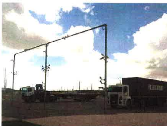
Leitura de placa por OCR