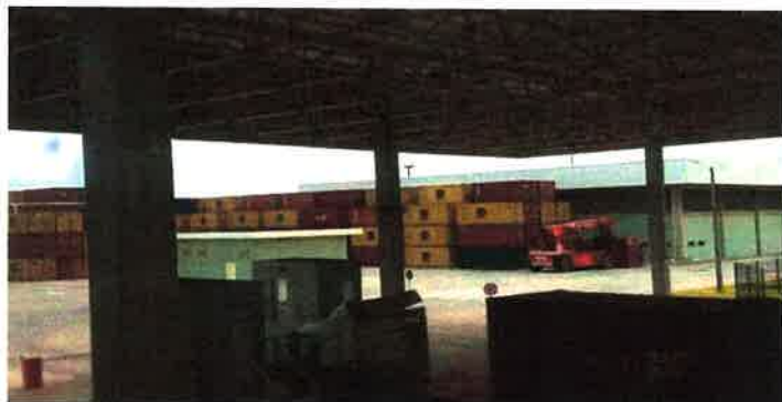
Armazém com pátio elevado